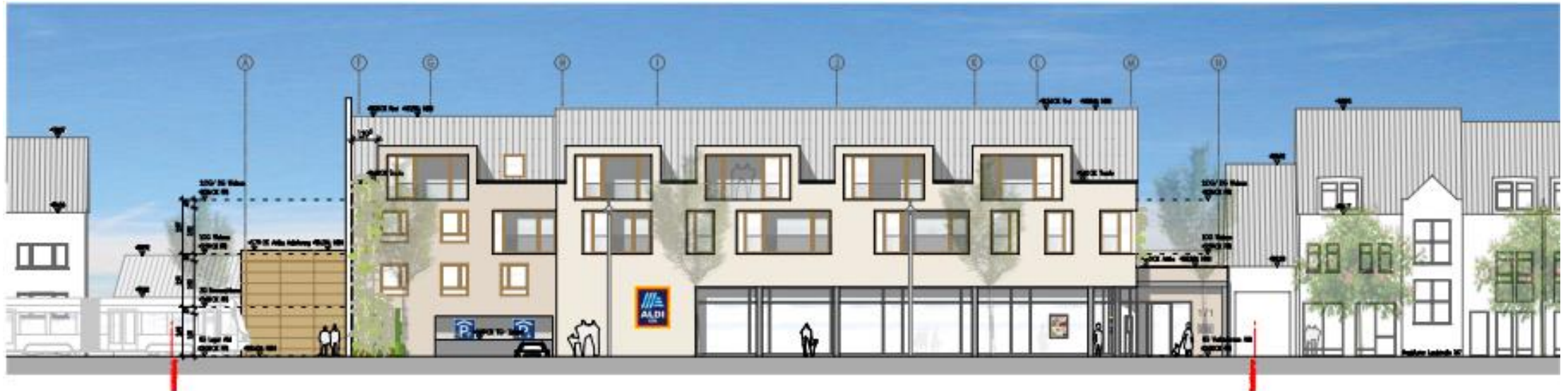
Ansicht West 1 | 1-200